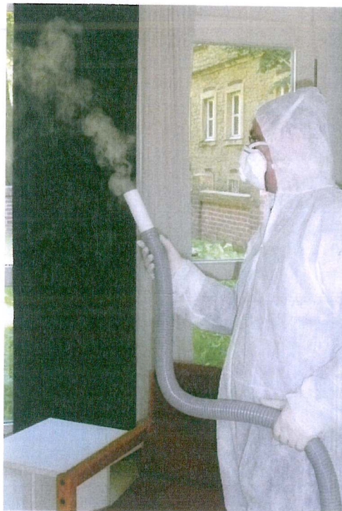
Raumluftdesinfektion: Über den Nebel werden auch nicht befallene Wände und Gegenstände dekontaminiert

Anovis Biotech GmbH Theodor-Schwarte-Straße 61 59227 Ahlen Fon (0 23 82) 7 60 97 - 48 Fax (0 23 82) 7 60 97 - 45 www.anovis-gmbh.de